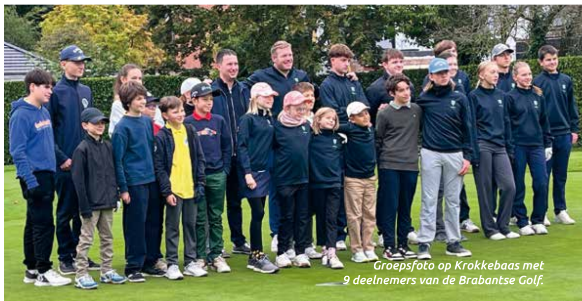
Groepsfoto op Krokkebaas met 9 deelnemers van de Brabantse Golf.