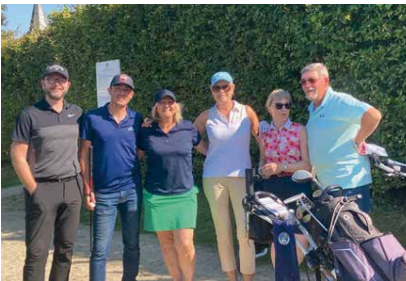
Klaar voor een weekend tornooi: spelers en begeleiders.