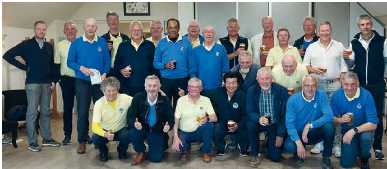
Men-on-the-Run: met 30 moedige strijders naar Valenciennes.

Volgend jaar gaan we de Bataven in de Veluwe verslaan. Zoals gekend leefden de Oude Belgen van de jacht en de visvangst. De Bataven waren krijgers en dronken mede! Alle gekheid op een