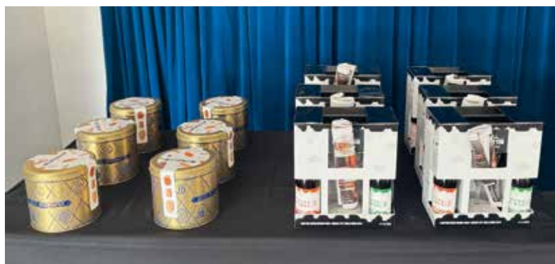
Slechts een kleine greep uit de grote prijzentafel.

Carine, onze Ladies' kapitein, spreekt warme woorden van dank uit, maar ook van waardering