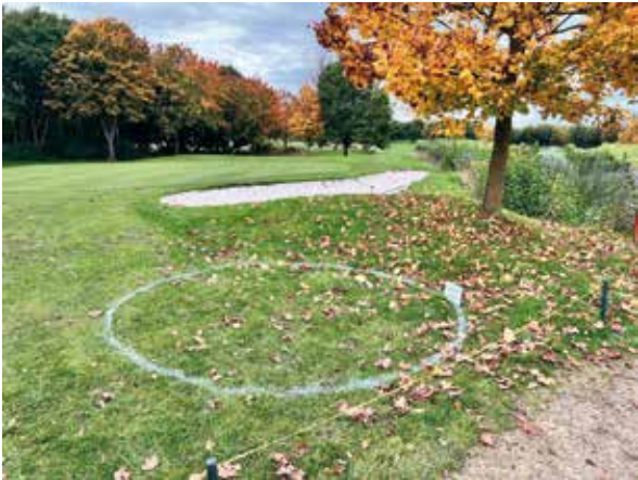
De dropping zone op hole 4.

onderdeel van het strafgebied, alhoewel je visueel wel één grote plas zal zien.