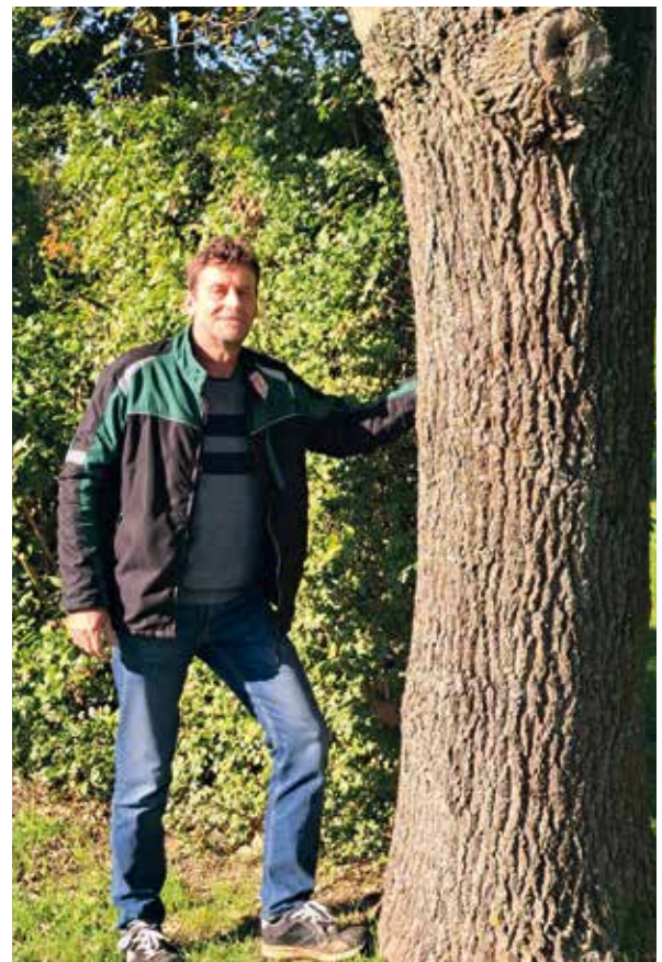
Ja, bij een eik van toen gaan staan, dat stemt tot nadenken.