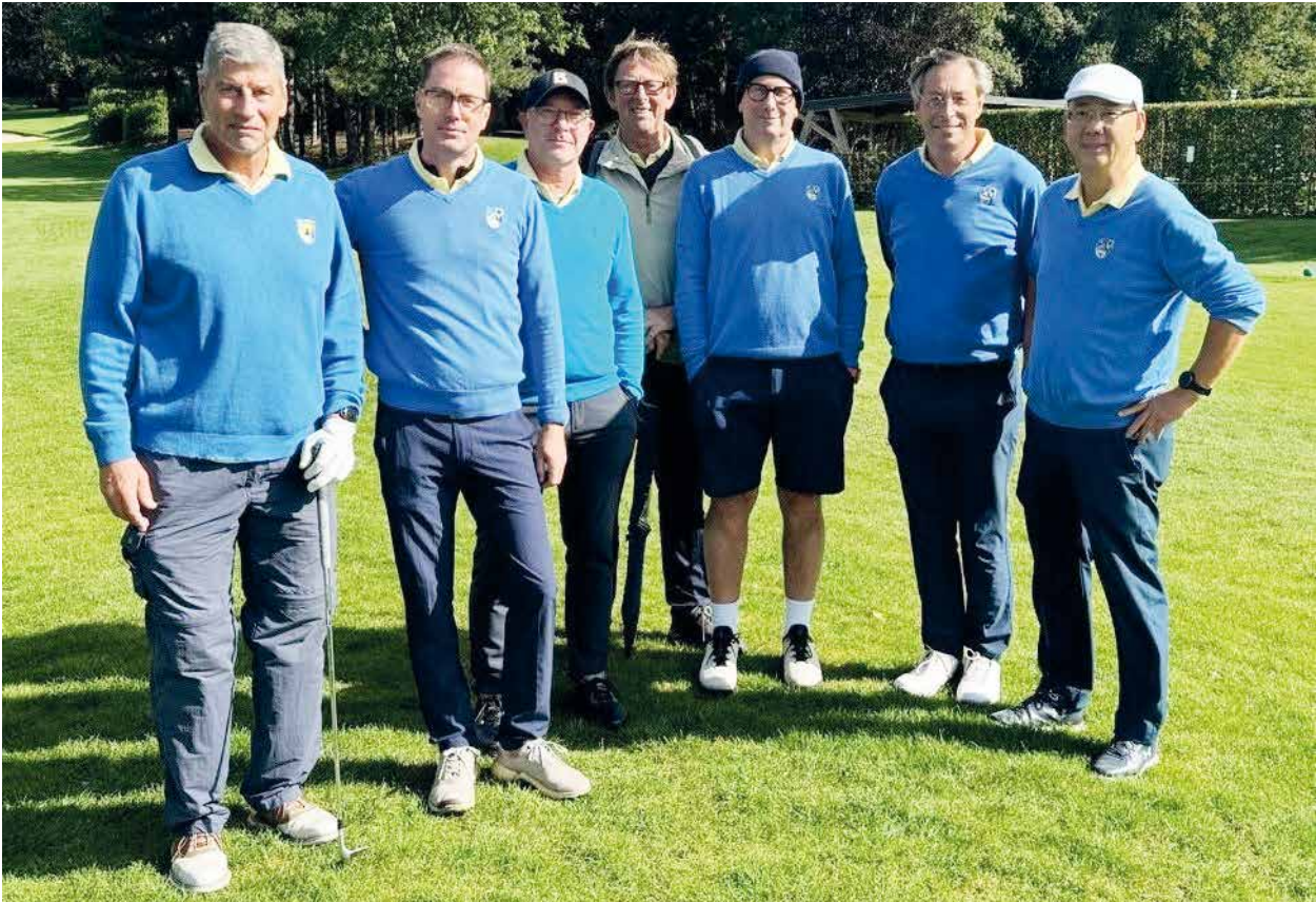
Senioren Heren II, klaar voor de strijd tegen Krokkebaas op Rigenée.

een hieropvolgende te korte zomerperiode. Dit was voor onze IC spelers niet anders, want het was weer een editie die veel flexibiliteit vroeg van al onze teams.