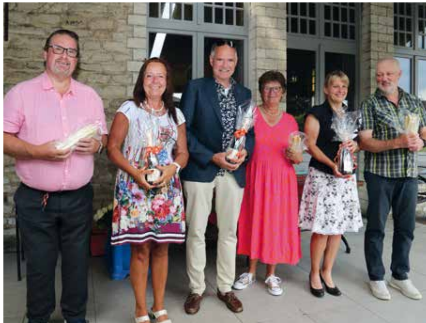
Ze vielen dit jaar ook in de prijzen op het Echtparentornooi.