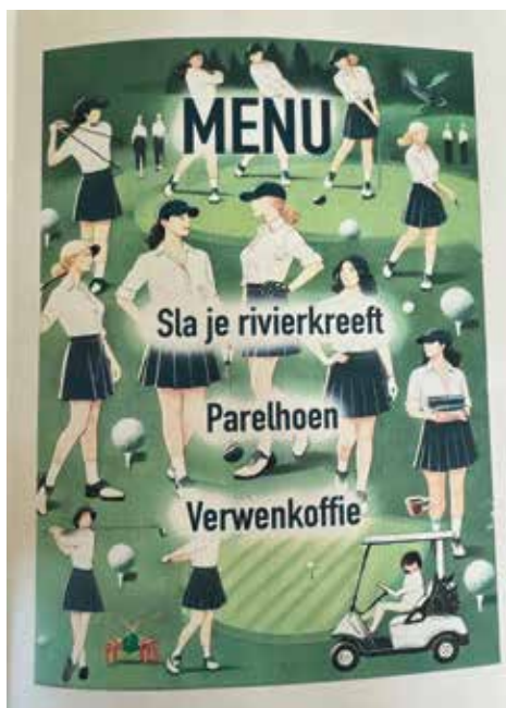
Een originele menukaart.

voor alle geleverde prestaties, gedreven door sport.