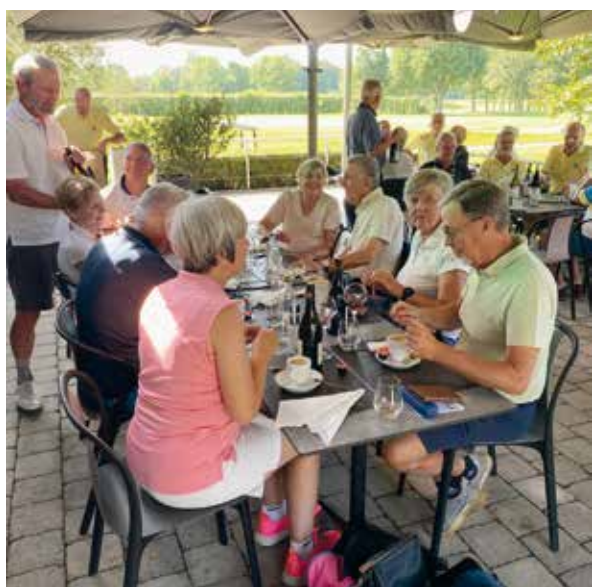
De jaarlijkse BBQ met prijsuitreiking, succes verzekerd.

Hoewel donkere wolken dreigend boven de baan hingen, bleef de regen grotendeels uit. Dit gaf de spelers de kans om hun volledige ronde af te