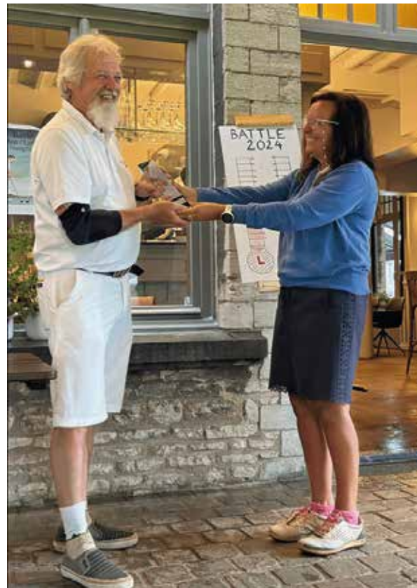
Met één luttel punt wisten we de Battle Wisselbeker te bemachtigen.

De netto matchplay competitie loopt eveneens op haar einde en de ½ finale en finales worden