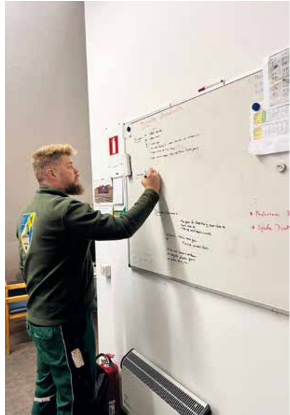
Dankzij de planning op het bord weet iedereen wat er moet gebeuren.

Wij proberen zo weinig mogelijk het golfspel te verstoren en de leden zijn zich bewust van de risico's die wij lopen, meestal toch.