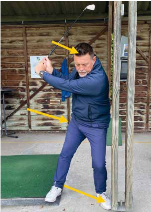
Lateraal en naar beneden. Spatie tussen lichaam en paal is weg.