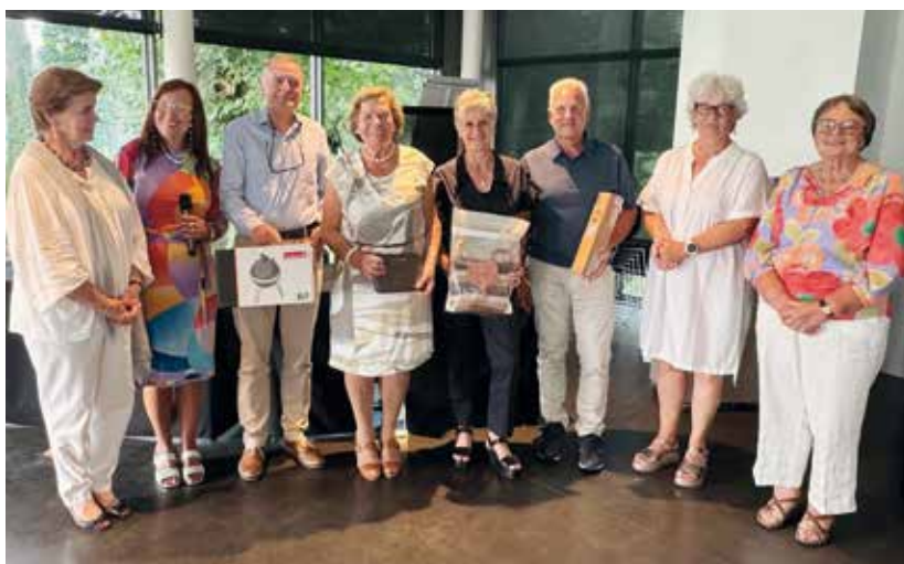
Enkele tevreden prijswinnaars, het perfecte evenwicht M/V.