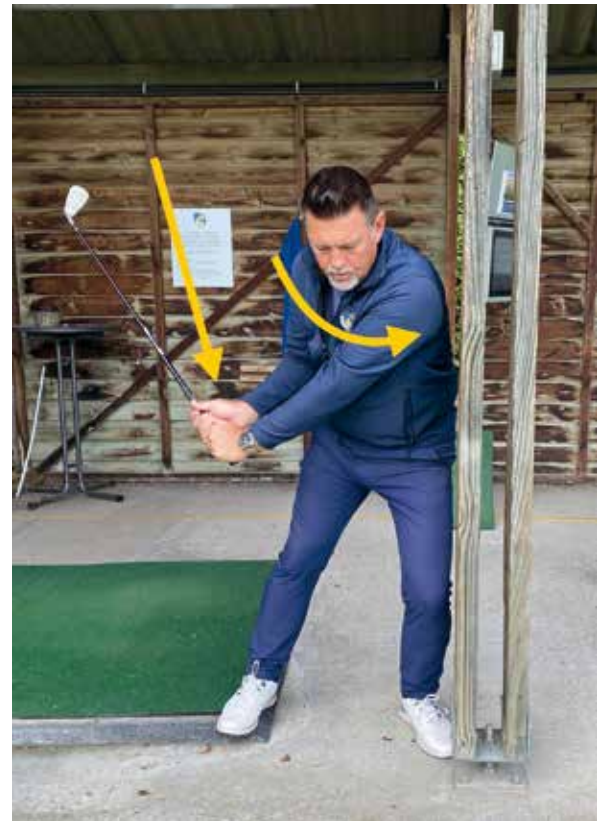
Veel ruimte om de club te laten vallen en de schouders te roteren.

Dames gaan dus een green helemaal anders moeten aanvallen dan een heer die hard slaat. Bij de dame zal de bal meer rollen en bij de heer stopt hij sneller door de hogere spin.