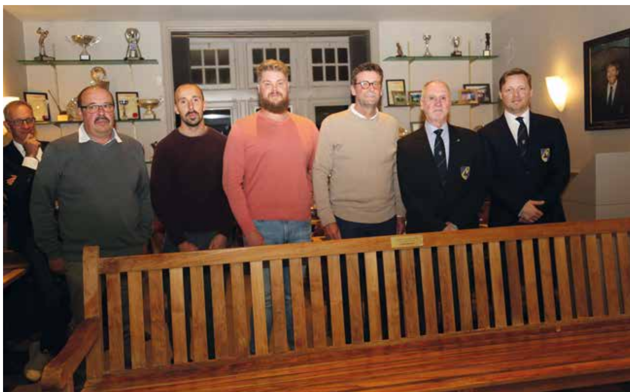
Groenploeg en bestuur samen bij de nieuwe bank.