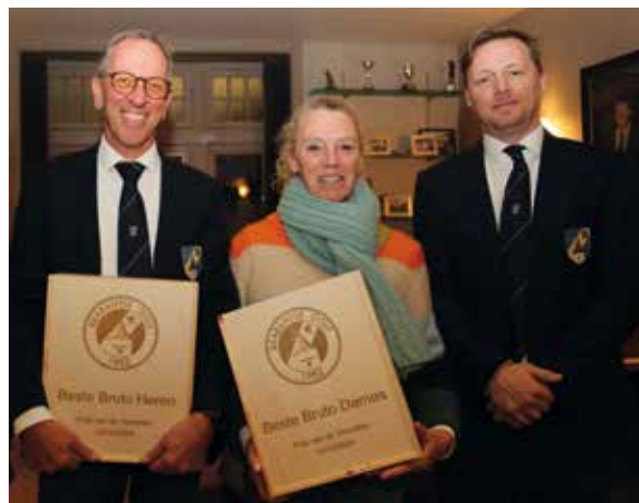
Gelukkige winnaars van de 'beste bruto' prijzen.