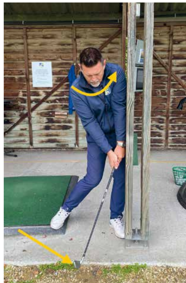
Schouders en heupen roteren en behoud van maximale druk op de linkervoet. Clubhoofd gaat in dalende actie naar de bal. Handen zijn voor de bal bij impact.