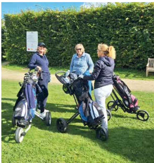
Drie BGA-dames wachten op hun start voor een mid-week toernooi.

De beginnende golfer start met hcp 54. Eerst komt er een theoretische test en een baantest. Hij/zij krijgt dan hcp 52 en moet nadien telkens 20 punten behalen op 9 holes om zo geleidelijk naar hcp 36 te zakken.