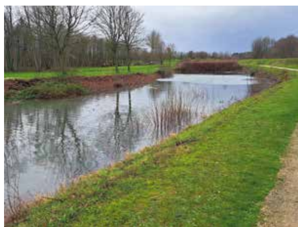
Mocht de geul tussen de holes 3 en 4 ooit overlopen tot op (een deel van) de respectieve fairways, dan staat er water in het algemeen gebied.

Er is geen recht van uitwijken onder Regel 16