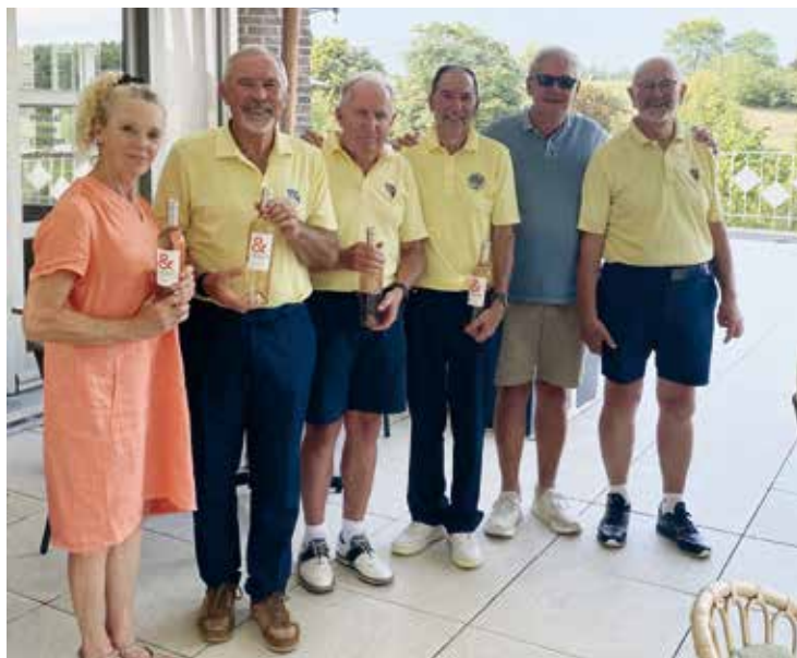
Prijsuitreiking van de Explorado in Spiegelven.

“De winnaars van de diverse zomercupwedstrijden werden onder luid applaus gehuldigd.”