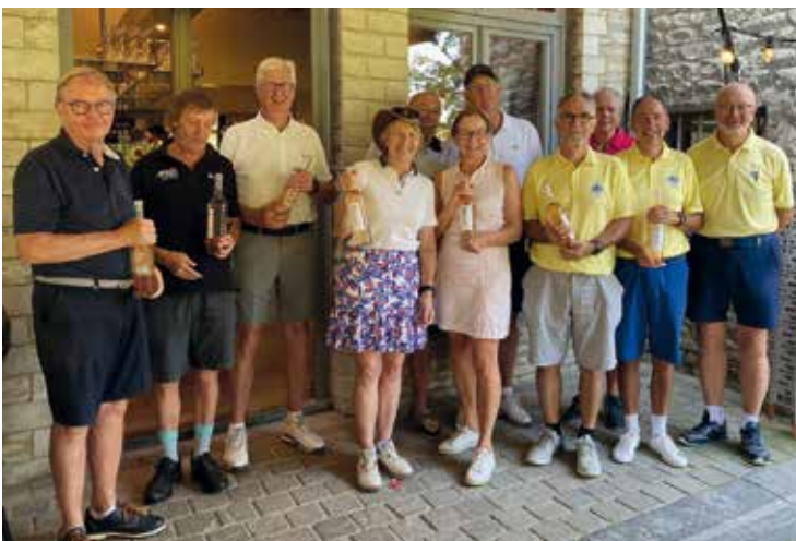
Winnaars van de zomershotgun-wedstrijd.

Op dinsdag 27 augustus was het tijd voor een van de meest geliefde tradities van het seizoen: de jaarlijkse BBQ met prijsuitreiking. Deze bijeenkomst begon met een ontspannen zomershotgun-wedstrijd. Het was een moment van verpozing, waarbij de prestaties van de eerste helft van het zomerseizoen gevierd werden.