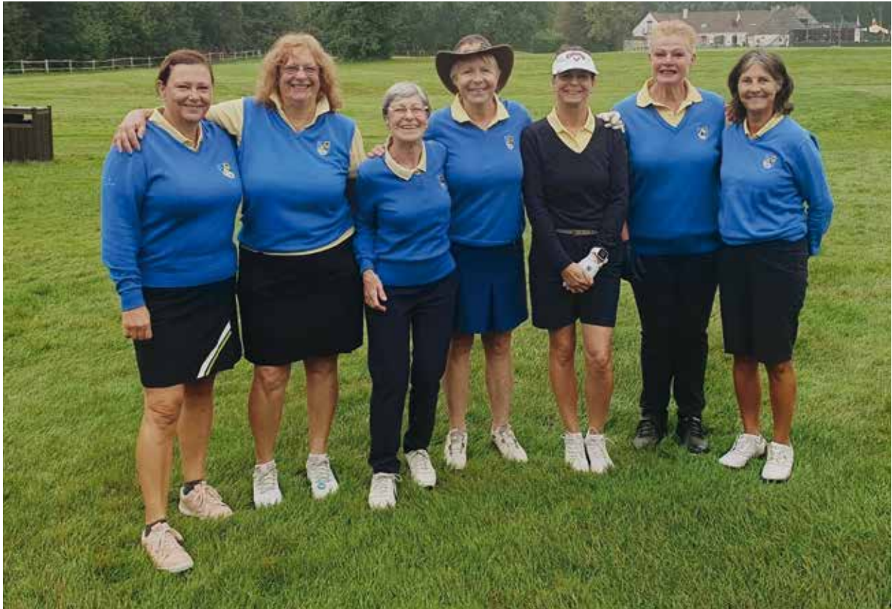
Seniores Dames II zoekt en vindt nieuw bloed! De toekomst is verzekerd.