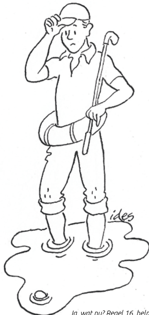
Ja, wat nu? Regel 16, help mij.