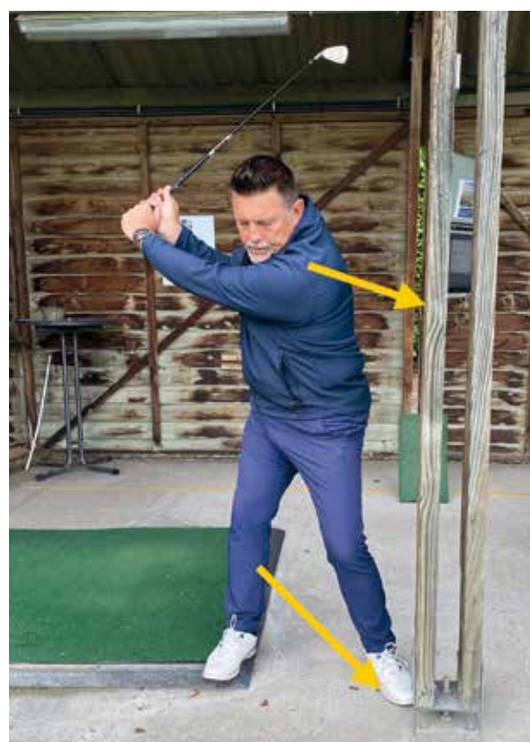
Backswing af. Klaar om te starten naar beneden.

Daarom lijkt het dat de bal laag vertrekt en dan pas na de eerste 50 m omhooggaat. Door die