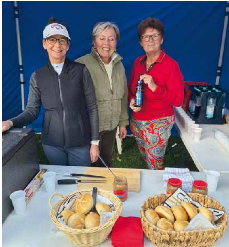
Op de Duitse Dag voor de Ladies, vielen de broodjes met Leberkäse erg in de smaak.

Verder helpt zij bij de NAVO met de jaarlijkse Charity Bazar. Mensen van veel verschillende nationaliteiten verkopen er hun ambachtelijke handwerken voor het goede doel.